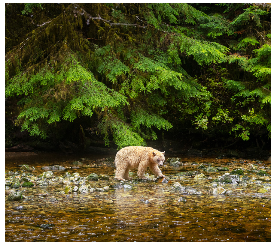
Los fondos del Bezos Earth Fund contribuirán a garantizar la protección a largo plazo de aproximadamente 101200 hectáreas (250 000 acres) de bosques antiguos que son el hábitat de animales silvestres, como este oso Kamode de la Columbia Británica de Canadá, y a respaldar el trabajo climático en toda la zona de Emerald Edge.

Solución: La preservación de los bosques costeros conjuntamente con los pueblos originarios privilegia un enfoque de gestión liderado por los indígenas, y al mismo tiempo protege la existencia de los bosques como reservorios de carbono.