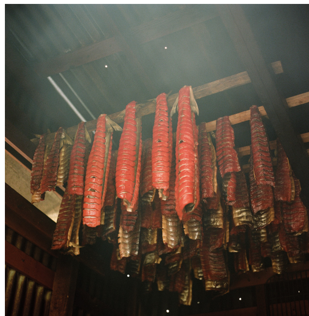
© BRIAN ADAMS (布里斯托尔湾)；© JOÃO RAMÍM (亚马孙)

采摘可可果实制作巧克力有助于为亚马孙雨林的重新造林提供支持，并且能够为小规模农户带来稳定收入。