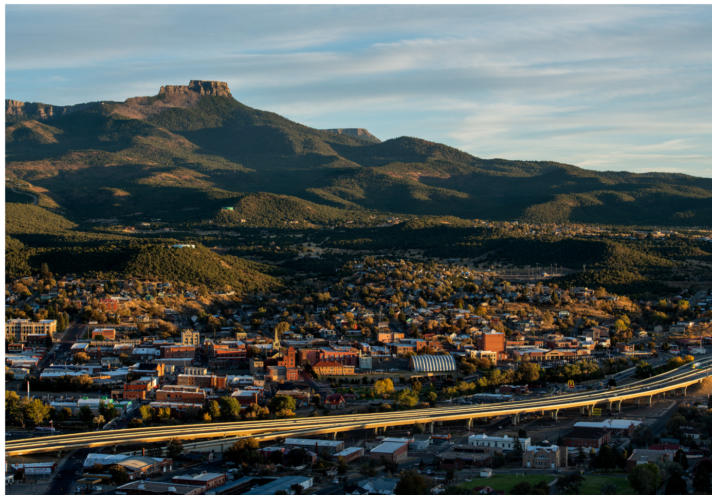
新建成的费舍尔山（Fishers Peak）州立公园占地1.92万英亩，可俯瞰科罗拉多州特立尼达市全貌，此处新的娱乐休闲机会将给当地经济带来一大利好。